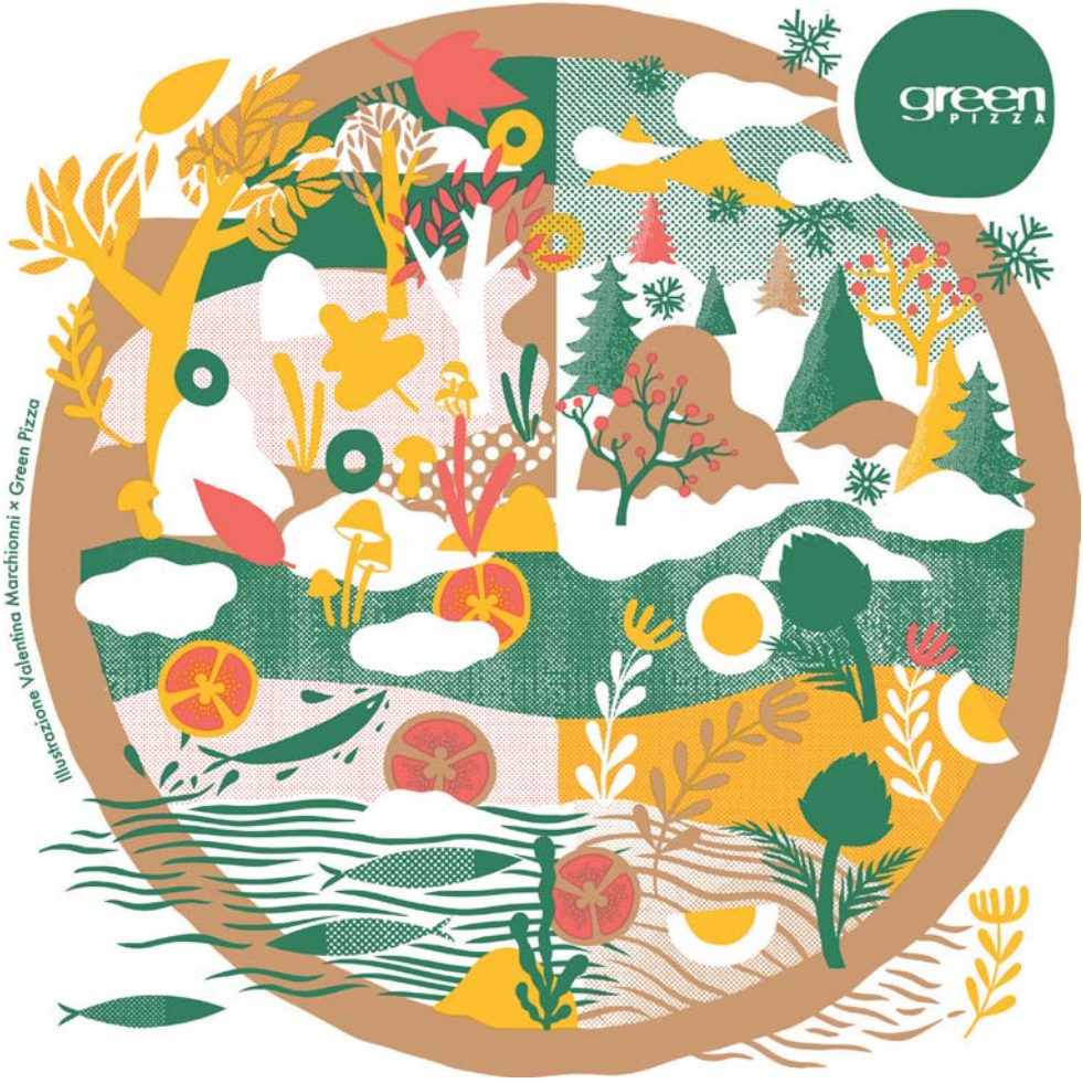
Illustrazione di Valentina Marchionni x Green Pizza