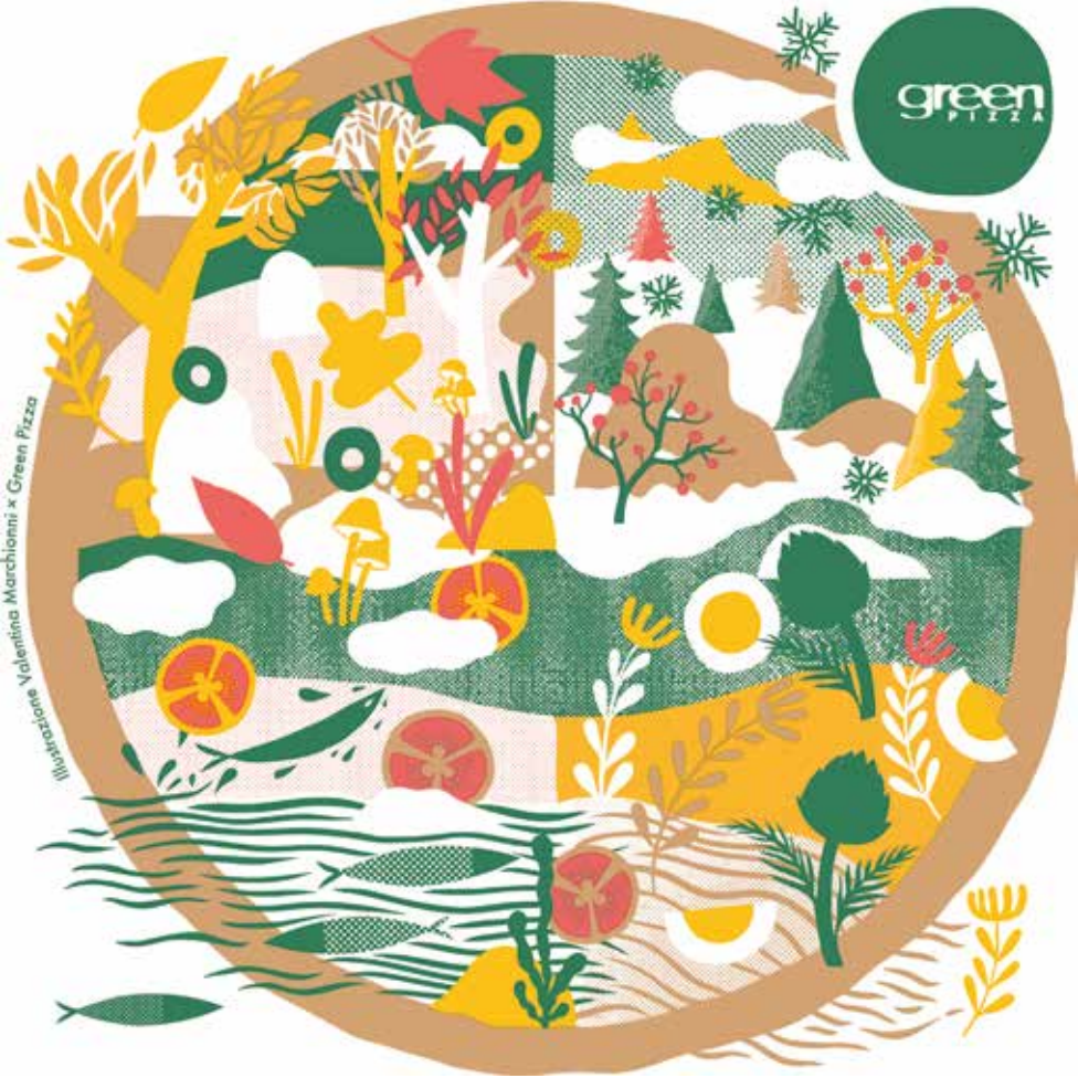
Illustrazione Valentina Marchionni x Green Pizza